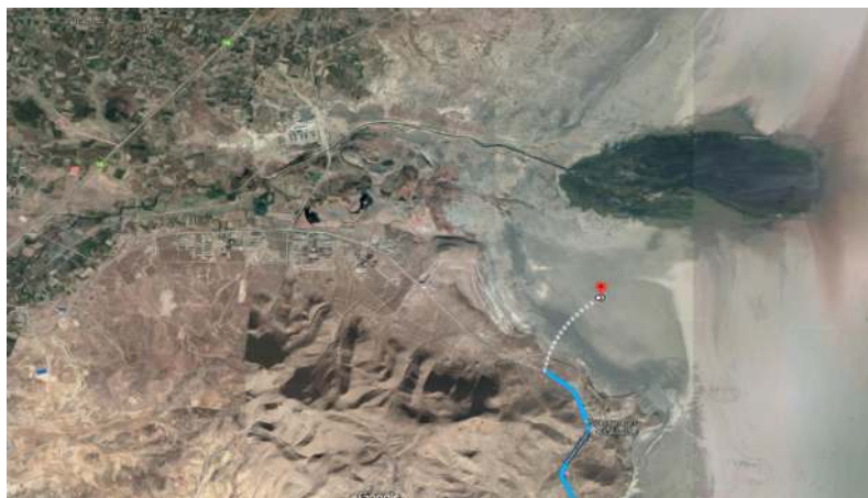
شکل ۱: موقعیت منطقه مورد مطالعه

ایجاد می‌شود. گرده افشانی این گیاه توسط باد است. میوه‌ها کوچک و آبدار و به شکل یک بذر منفرد می‌باشند که همراه با کامل شدن مراحل رشد میوه، گیاه از سبز به قرمز تغییر رنگ می‌دهد. بذرهاى این گیاه بدون پوشینه و سیاه رنگ است. رویشگاه طبیعی این گیاه نمک‌زارها، سواحل دریا، باتلاق‌ها و مرداب‌های شور اروپا، جنوب آسیا، شمال آمریکا و جنوب آفریقا است. از میان ۱۵ گونه سالیکورنیا در جهان هفت گونه آن در ایران وجود دارد. رویشگاه‌های این گیاه در ایران شامل استان‌های فارس، سمنان، گرگان، خوزستان، بوشهر، هرمزگان، یزد، آذربایجان غربی، آذربایجان شرقی، اصفهان، قم و تهران می‌باشد (۱۵).