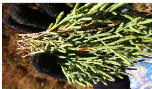
شکل ۲: گونه Salicornia europaea

ایجاد می‌شود. گرده افشانی این گیاه توسط باد است. میوه‌ها کوچک و آبدار و به شکل یک بذر منفرد می‌باشند که همراه با کامل شدن مراحل رشد میوه، گیاه از سبز به قرمز تغییر رنگ می‌دهد. بذرهاى این گیاه بدون پوشینه و سیاه رنگ است. رویشگاه طبیعی این گیاه نمک‌زارها، سواحل دریا، باتلاق‌ها و مرداب‌های شور اروپا، جنوب آسیا، شمال آمریکا و جنوب آفریقا است. از میان ۱۵ گونه سالیکورنیا در جهان هفت گونه آن در ایران وجود دارد. رویشگاه‌های این گیاه در ایران شامل استان‌های فارس، سمنان، گرگان، خوزستان، بوشهر، هرمزگان، یزد، آذربایجان غربی، آذربایجان شرقی، اصفهان، قم و تهران می‌باشد (۱۵).